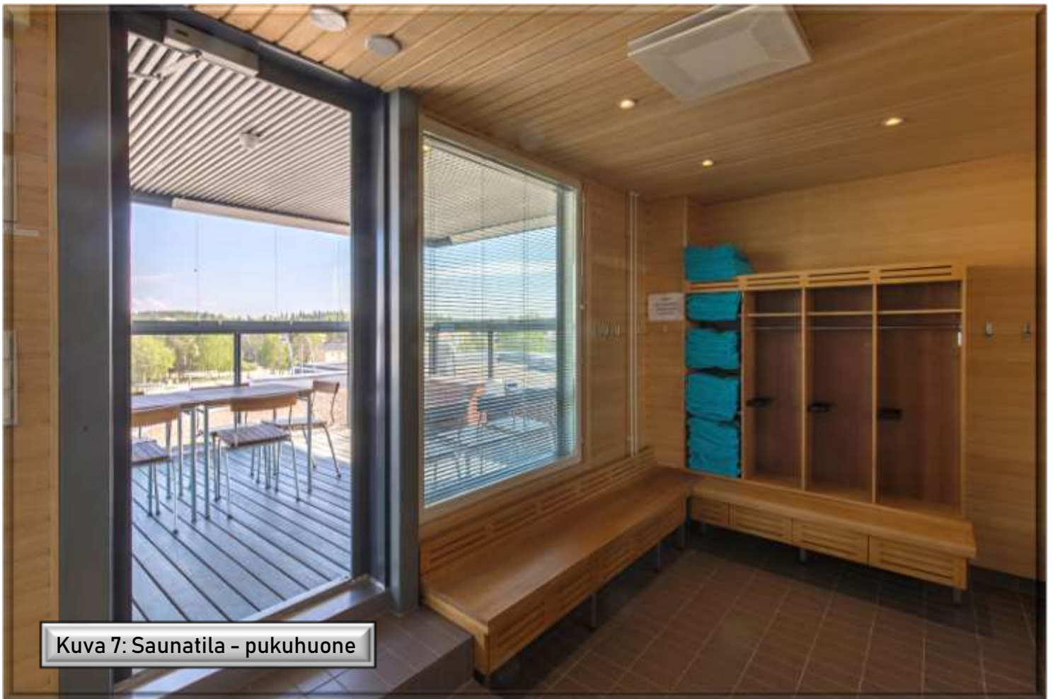
Kuva 7: Saunatila - pukuhuone