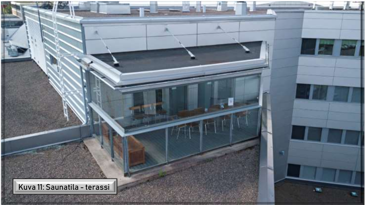
Kuva 11: Saunatila - terassi