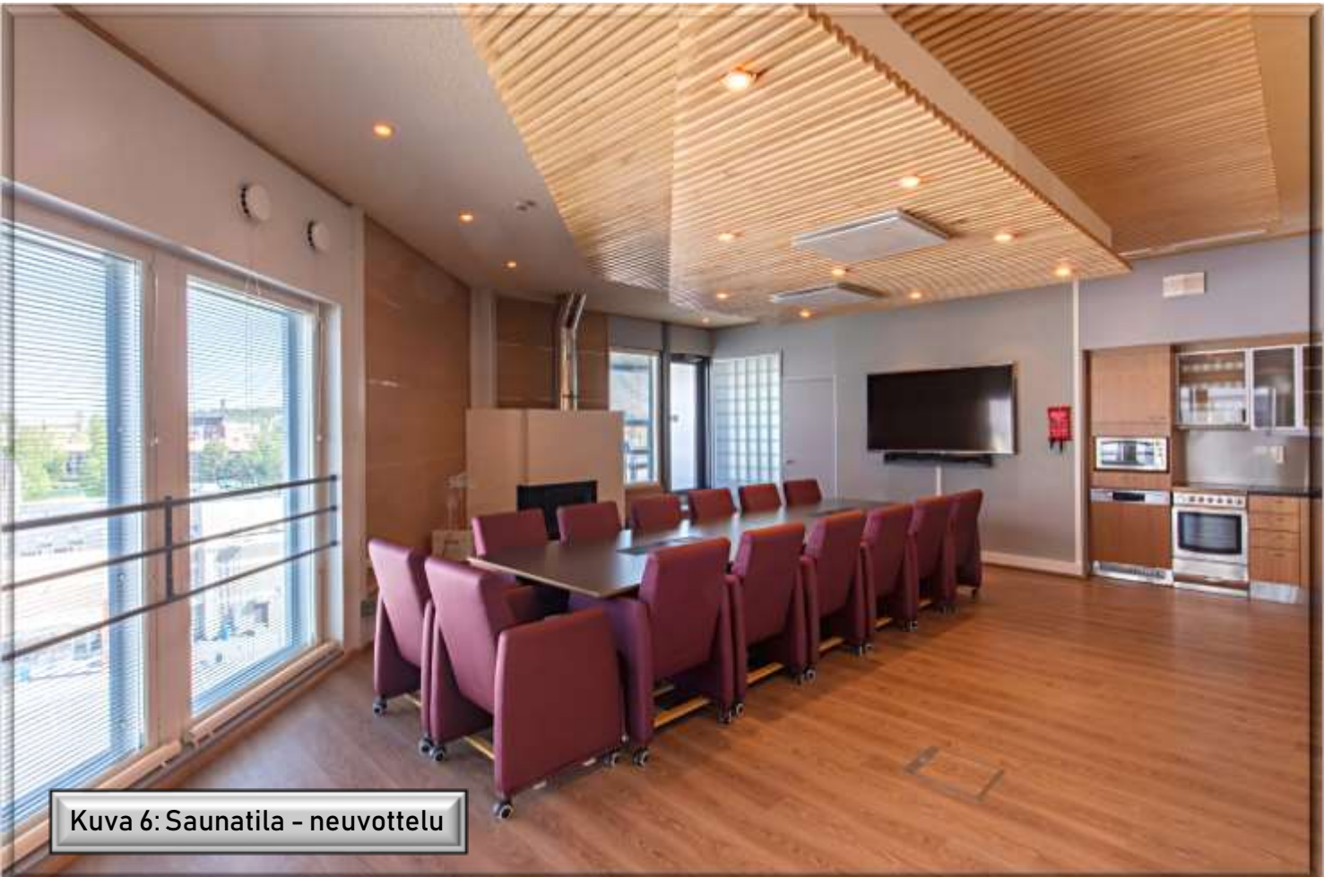
Kuva 6: Saunatila - neuvottelu