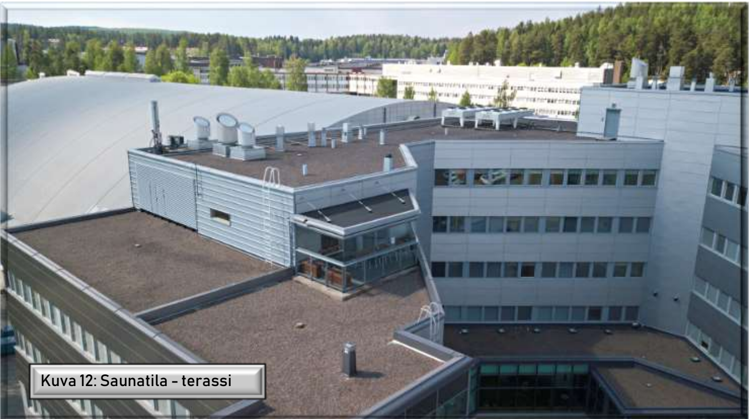
Kuva 12: Saunatila - terassi