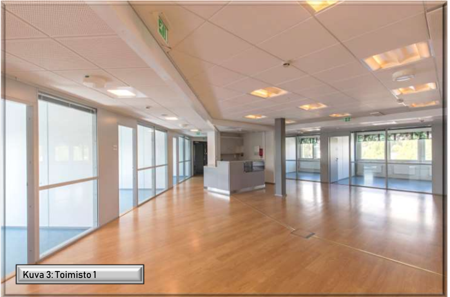
Kuva 3: Toimisto 1