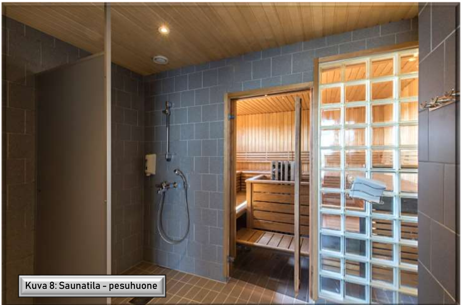
Kuva 8: Saunatila - pesuhuone