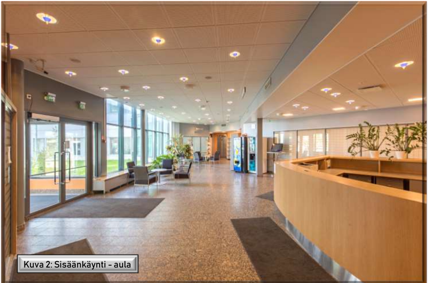
Kuva 2: Sisäänkäynti - aula