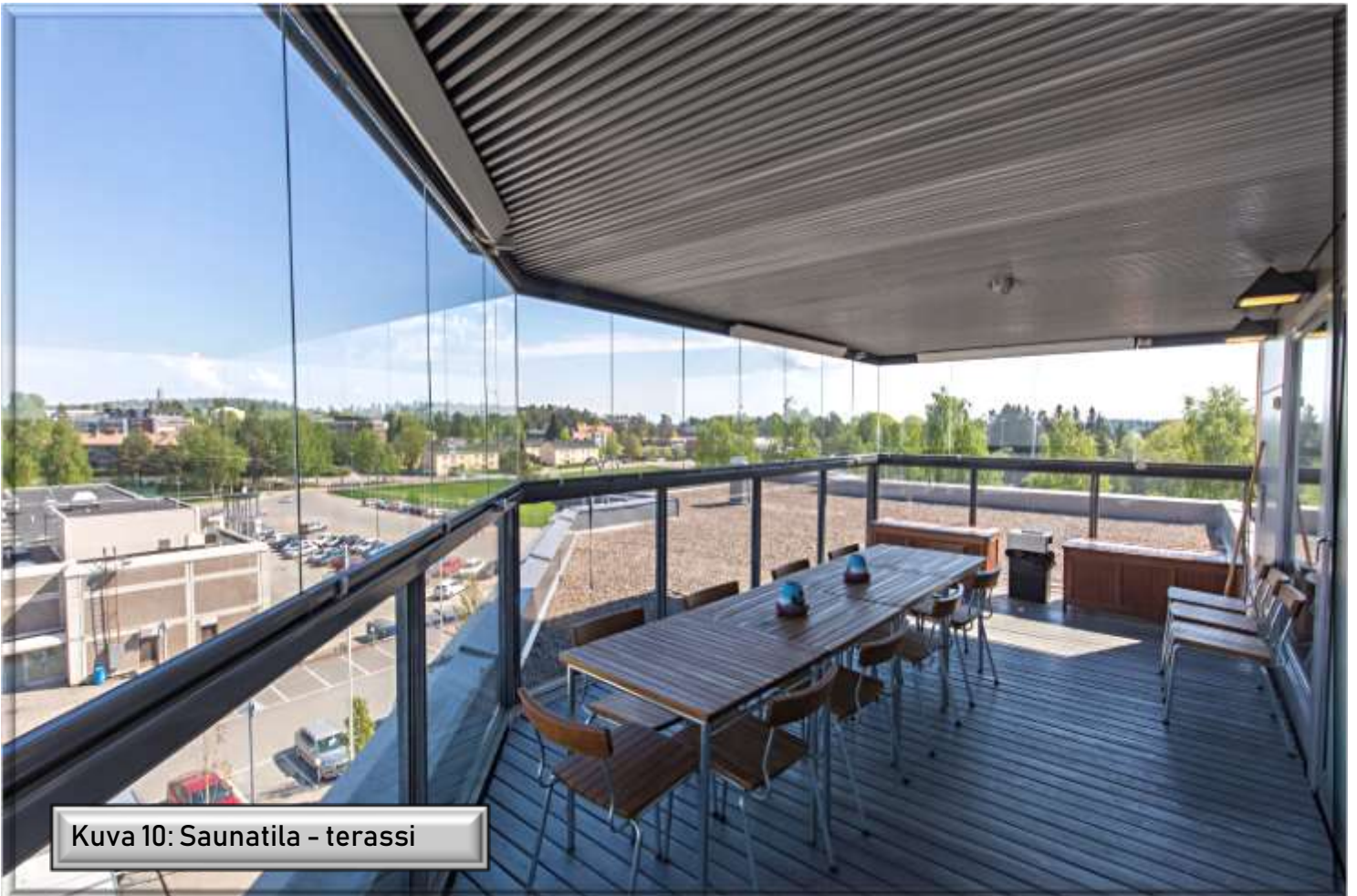
Kuva 10: Saunatila - terassi