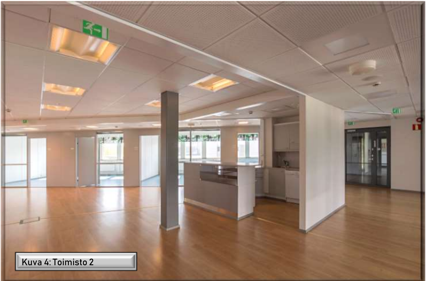
Kuva 4: Toimisto 2