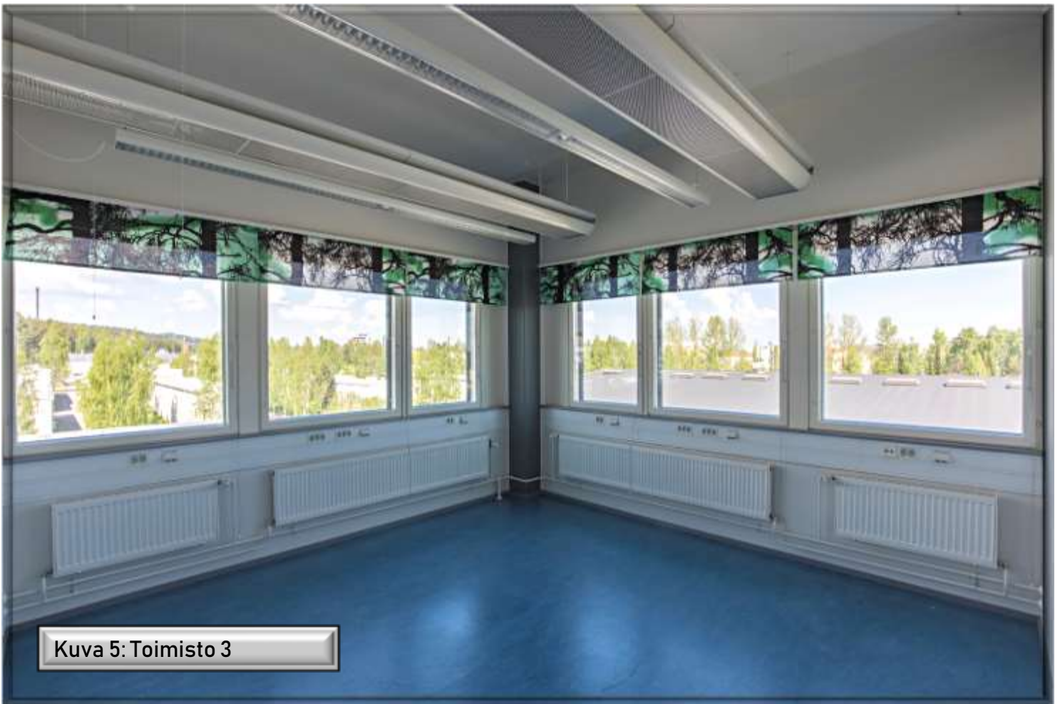
Kuva 5: Toimisto 3