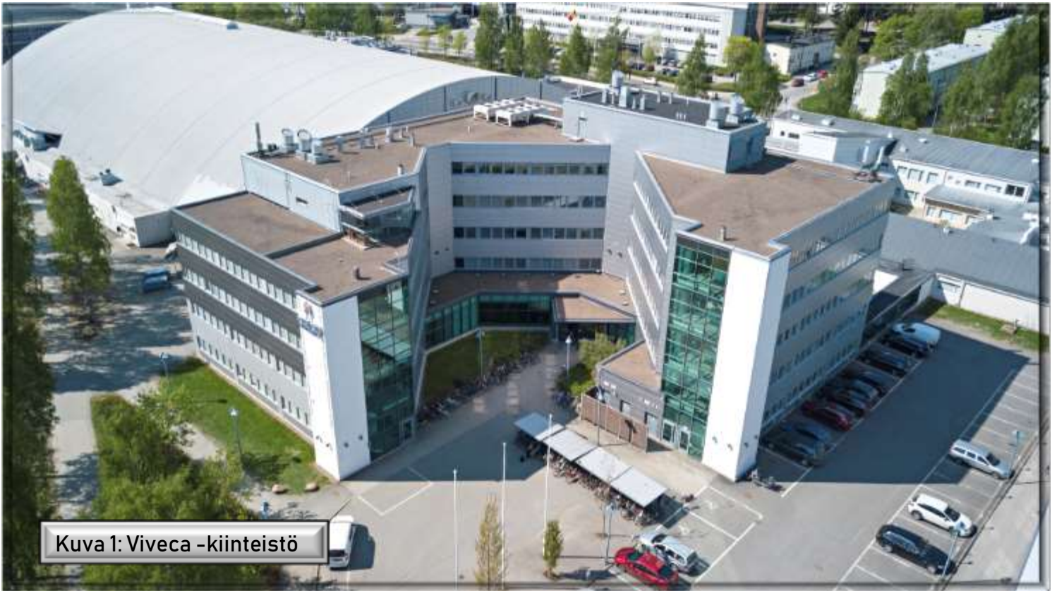
Kuva 1: Viveca -kiinteistö